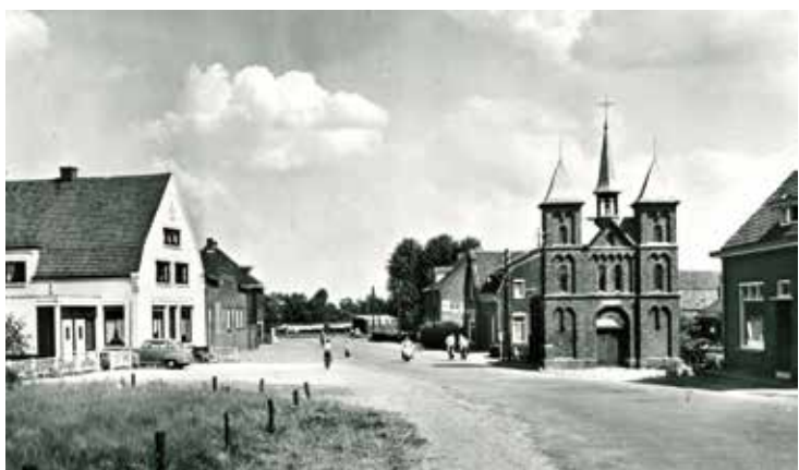
De Sint Rochuskapel van Budshop gezien vanaf Brug Vijftien, op een Ansichtkaart van circa 1955.

De Corona-infectie of Covid-19-epidemie heeft de wereld in zijn greep en houdt ons zowel letterlijk als figuurlijk van de straat. Als het gaat om besmettelijke ziekten hebben onze voorouders trouwens al heel wat voor hun kiezen gehad. In deze miniserie nemen we u mee in de geschiedenis van pest, diarree en griep in Nederweert. Het wordt geen bijzonder vrolijk verhaal en hopelijk herhaalt de geschiedenis zich niet. Deze week de vijfde en laatste aflevering, verzorgd door de Stichting Geschiedschrijving Nederweert.