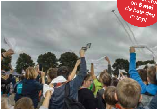
Theo Bovens, gouverneur

De fakkel van de vrijheid blijft daarmee branden!